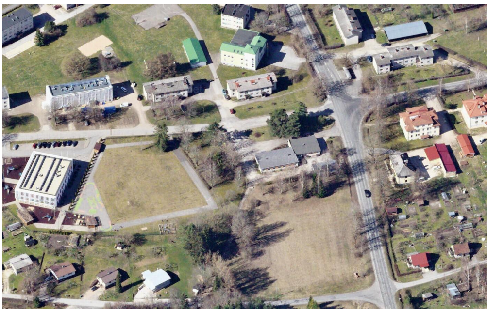
Vaade planeeritavale alale linnulennult. Väljavõte Maa-ameti fotoarhiivi ülelennu 2023-04-20 fotost